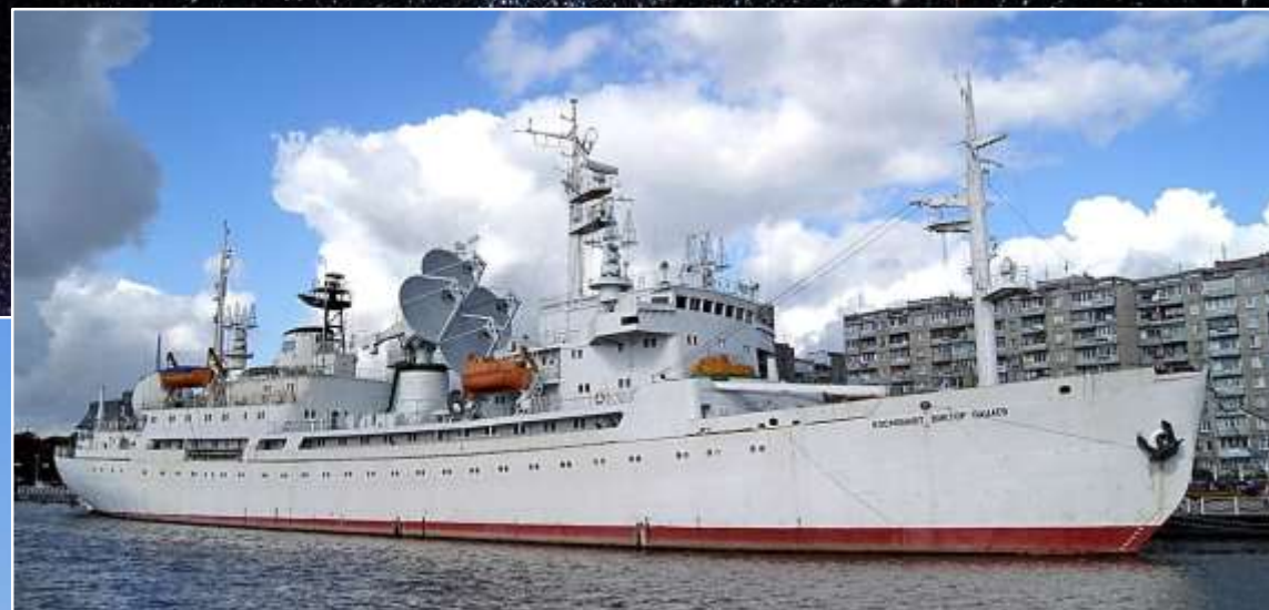
НИС «Космонавт Виктор Пацаев» и КИК «Маршал Крылов» (ВМФ)